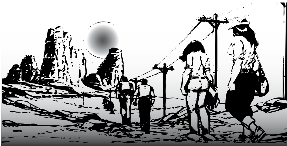
Guía del migrante mexicano

No había pensado en un muro así. Claro, veíamos tele, sabíamos que Estados Unidos estaba fortaleciendo su frontera contra los migrantes ilegales como nosotros. Lo llaman «Cortina de la Tortilla», pero eso es un eufemismo.