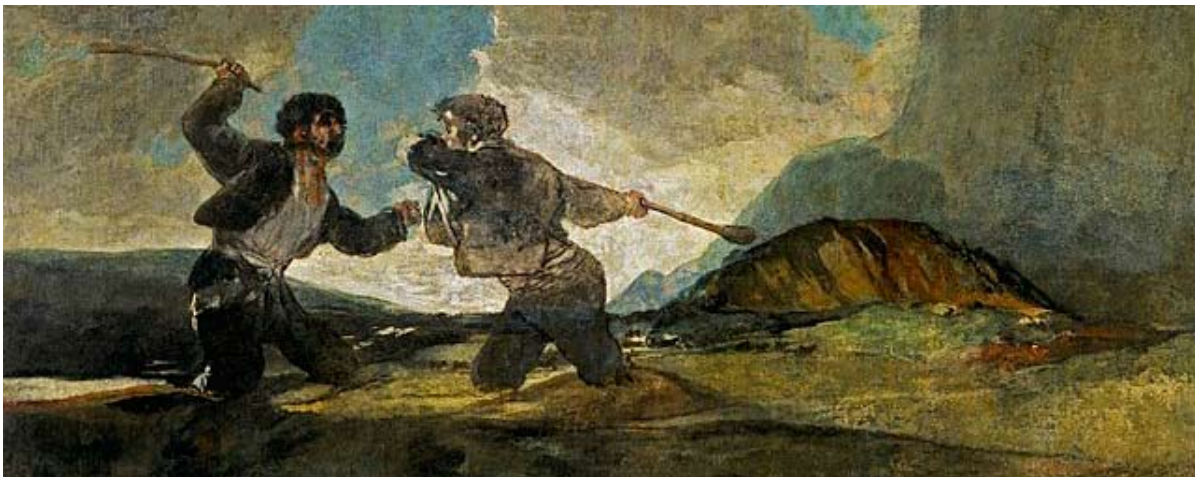
Francisco de Goya: Duelo a garrotazos (1823).

( https://es.wikipedia.org/wiki/Duelo_a_garrotazos <22.12.2016>)